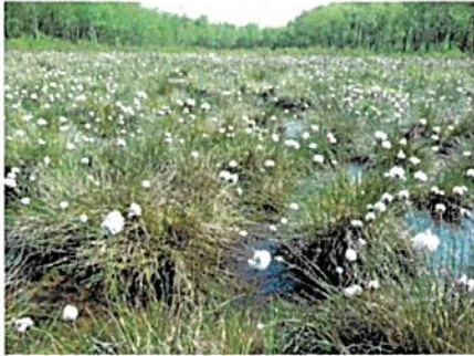
Schönwolder Moor

für die Strom- und Wärmeversorgung von Schulen und zur Kompetenzförderung in diesem wichtigen Bereich in ganz Deutschland dient.