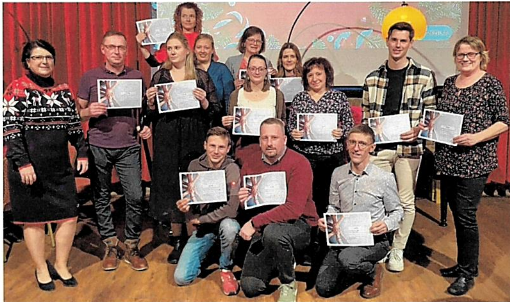
Scheckübergabe bei der Veolia Wasser Deutschland

Bereits zum elften Mal konnten sich im Rahmen des Programms ProEhrenamt Beschäftigte von Veolia aus ganz Deutschland um 500 Euro für eine gemeinnützige Organisation bewerben, in der sie sich mindestens 100 Stunden pro Jahr ehrenamtlich engagieren. 2024 unterstützte die Veolia Stiftung auf diese Weise die Arbeit von insgesamt 100 Organisationen mit jeweils 500 Euro. Die symbolischen Förderschecks wurden anlässlich des internationalen Tags des Ehrenamts im Dezember 2024 übergeben und stellen eine wichtige Würdigung des freiwilligen gesellschaftlichen Engagements dar.