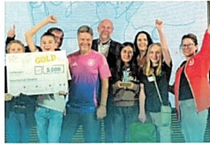
Impressionen der Arbeit von co2online